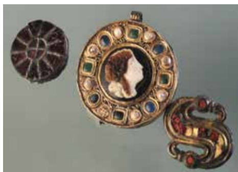
Oggetti provenienti da un corredo femminile di una sepoltura longobarda della necropoli di Spilamberto

All'interno del Museo Bebedettino e Diocesano di Arte Sacra di Nonantola è possibile vedere un oggetto bizantino, ovvero uno dei due sciamiti, rarissimi tessuti rinvenuti fortuitamente in abbazia nel 2002 durante la campagna di inventariazione dei beni culturali ecclesiastici. Di straordinaria bellezza, il loro arrivo è ascrivibile al periodo immediatamente successivo alla fondazione del monastero, quando gli abati Pietro ed Anfrido furono ambasciatori per Carlo Magno presso Costantinopoli, venendone probabilmente omaggiati dallo stesso imperatore d'Oriente. Per lungo tempo utilizzati come corredo funebre di San Silvestro, sono stati conservati insieme alle sue reliquie e ad altri oggetti, insieme all'arca romana del santo, portata dagli stessi longobardi nel 756 dalle catacombe di Santa Priscilla lungo la Via Salaria.