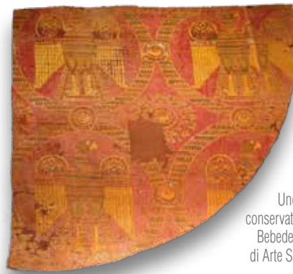
Uno dei due sciamiti conservati presso il Museo Bebedettino e Diocesano di Arte Sacra di Nonantola