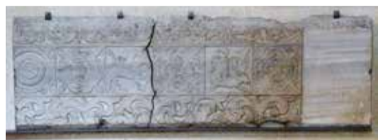
Pluteo che costituiva parte di una recinzione presbiteriale della Cattedrale altomedievale e che rivela sopra e sotto i medesimi bordi decorati mentre, nello spazio interno, mostra una successione di specchiature con fiori, croci gigliate, un grifone ed un'aquila che sovrasta una lepre

Il Museo Lapidario del Duomo di Modena custodisce parecchie testimonianze della cultura figurativa longobarda che costituiscono gran parte dell'arte medievale preromanica precedente la Cattedrale di Lanfranco e Wiligelmo.