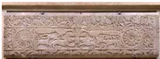
Lastra con la croce e animali affrontati. IX secolo

Diversi plutei, appartenenti alla Cattedrale precedente all'attuale e oggi conservati nel Museo Lapidario, mostrano l'influsso di apporti culturali diversi, fondendo suggestioni bizantine e longobarde. Il pluteo ora nell'abside superiore sinistro del Duomo, mostra un riquadro centrale con animali affrontati collocato ai lati di una croce. A fianco vi sono riquadri con grandi rosette e croci gigliate, elementi presenti nell'arte orientale già alla fine del IV secolo.