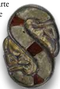
Fibula a "S" in argento dorato con granati. Corredo di tomba longobarda. Fiorano, Fornace Ape. Fine VI secolo

Al periodo fra la fine del VI e la metà del VII secolo sono stati attribuiti i corredi di due sepolture longobarde rinvenute nel territorio: la tomba di Montale apparteneva probabilmente ad una donna longobarda di rango elevato come dimostrano gli elementi di abbigliamento, fra cui le splendide fibule a staffa, e la preziosa brocca in bronzo fuso; la tomba di Fiorano, era accompagnata da un corredo, probabilmente non completo, di cui facevano parte una raffinata fibula a S ed una serie di vaghi di collana.